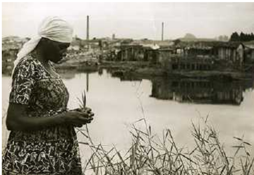
Figura 1: Carolina Maria de Jesus à margem do Rio Tietê e, ao fundo, a favela do Canindé