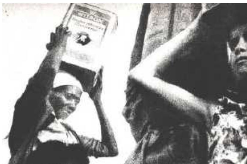
Figura 4: Lata d' água na cabeça

Quando eu ouvia os rumores pensava: quem teve filhos nesta idade foi só Santa Isabel, mãe de São João Batista. (JESUS, 2014, p. 57-58)