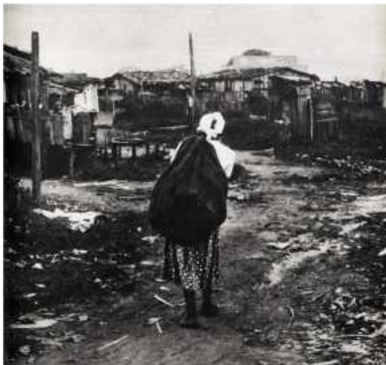
Figura 3: Carolina Maria de Jesus carregando papéis na favela do Canindé

Do centro de São Paulo, Carolina Maria de Jesus retornava à favela consciente dos atravessamentos da solidão que moldava os seus dias. A vida atribulada que levava empurrava-lhe ao isolamento diário, mesmo na companhia daqueles que habitavam as margens: “Quem vive na favela deve procurar isolar-se, viver só.” (JESUS, 2014, p. 48). Esse é um aspecto que revela os efeitos do racismo e das violências dele derivadas que fragilizam os laços entre as pessoas negras que sofrem sem estabelecer redes de amparo mútuo.