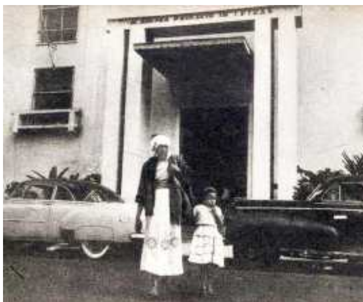
Figura 2: Carolina Maria de Jesus e Vera Eunice diante da Academia Paulista de Letras

que não tinha permissão para deixar que quem quer que fosse sentar-se na porta do prédio. ... Fomos na Rua 7 de Abril e o repórter comprou uma boneca para a Vera. (...) Eu disse aos balconistas que escrevi um diário que vai ser divulgado no “O Cruzeiro”. (JESUS, 2014, p. 165)