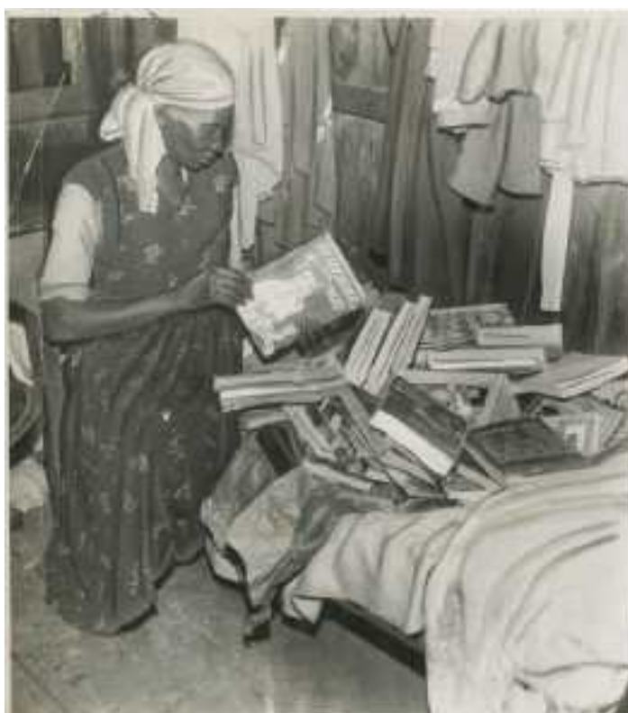
Figura 5: Acervo literário de Carolina Maria de Jesus

Parece paradoxal pensar em uma escrita da solidão quando percebemos que Carolina Maria de Jesus mal dispunha de um espaço estabelecido para uma escrita solitária: a narrativa da vida era itinerante, movente, outro fator que impossibilitava um exercício da solitude. Concebendo a solitude como um estado, me parece que o sujeito escrevente e comprometido com o próprio isolamento abriga-se na comodidade e no deleite desse transe vivido em lugares determinados para a produção artística. Escritoras negras como Carolina afastam-se dessa concepção. A esperança de possuir um lugar coeso de leitura e escrita, ainda que fosse no espaço da favela, emerge na narrativa: “[...] ganhei umas tábuas e vou fazer um quartinho para eu e escrever e guardar os meus livros.” (JESUS, 2014, p. 86).