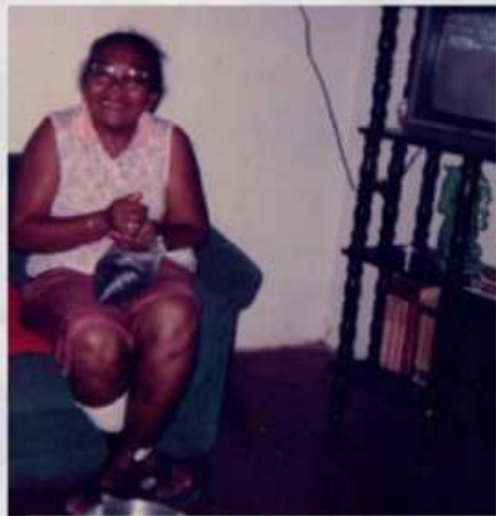
Catar peijão, recolher o grão da memória. Natal / RN - 1998

O quarto de minha avó era o lugar mais importante da nossa casa. Ela guardava os nossos segredos. Durante a semana, nele nos reuníamos ao final da tarde, quando as mulheres da família retornavam do trabalho e se punham a conversar sobre o dia transcorrido em um espaço pequeno, onde mal cabia eu, minha mãe, minha tia e minha avó. Narrávamos umas às outras os principais acontecimentos, desabafávamos, ríamos das piadas contadas por minha mãe, e planejávamos as tarefas a serem realizadas nos dias seguintes. Para mim, tratava-se de um espaço de acolhimento.