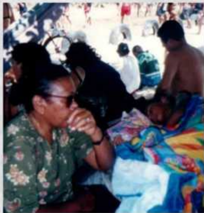
Vigília e nonho Puriza / RN - 2003

Na manhã do dia vinte e um de maio de mil novecentos e cinquenta e oito, Carolina Maria de Jesus despertava nervosa de um nonho bonito. Na noite passada, sonhara com uma bela casa, no centro de São Paulo, onde morava com os filhos. A casa era habitável: havia banheiro, cozinha e copa. A toalha de mesa, em que eram servidos bife, pão, manteiga, batata frita e salada, era alva feita lino. Mas, quando levava à boca um pedaço do bife que compunha o banquete, Carolina sentia o gosto amargo da realidade de em que se encontrava: sozinha, às margens do rio Tietê, na favela do Canindé, respirando o cheiro forte da lama que ocupava todo o espaço.