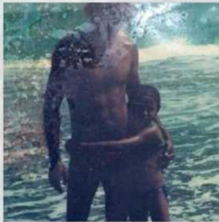
Memórias do mar Natal/RN - 2002

Foi meu pai quem me ensinou a tomar banho de mar. Fui de uma infância marítima, afeta às ondas e aos seus mistérios. Das recordações mais vividas de quando era pequena, uma se sobressai: o instante em que a força das águas acompanhava ondas maiores do que eu, ameaçando me engolir.