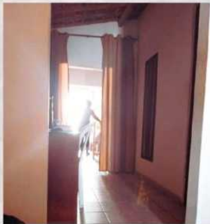
Escrita de comedor Natal/RN - 2019

As paredes de onde morei em Salvador Pangravam memórias que não eram minhas. Aquela sala nada sabia de mim. Eu que me demoraria neste lugar confrontando os vestígios de quem um dia fez morada nesses quartos, mas não consegui.