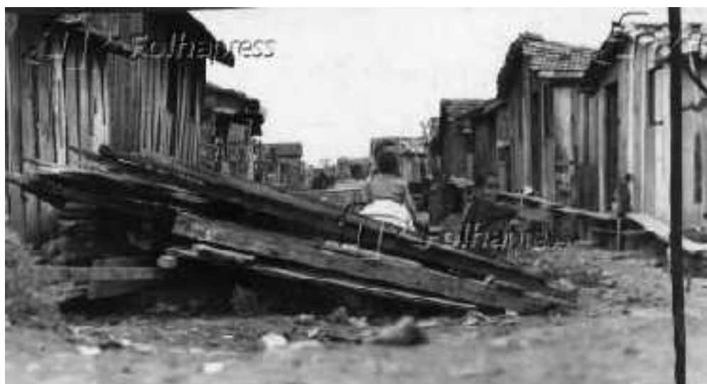
Figura 6: Moradores da favela do Canindé

era visitar a própria interioridade, versejando “o âmago das coisas” (EVARISTO, 2008, p. 122), sem se evadir por completo de toda a realidade que a cercava. Apesar da fuga, do encontro com a sua subjetividade, uma parte de si continuava absorvendo toda a vida ao redor. Na favela não havia espaço para intimidades nem segredos: “Dei o jantar aos filhos, eles foram deitar-se e eu fui escrever. Não podia escrever socegada as cenas amorosas que se desenrolavam perto do meu barracão. Pensei que iam quebrar a parede!” (JESUS, 2014, p. 126).